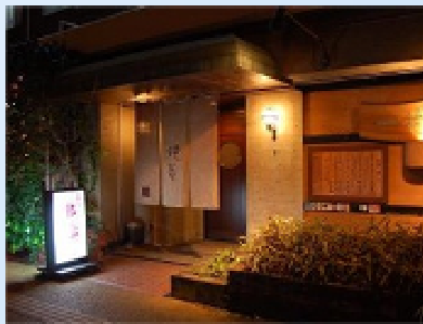
店内も粋な串揚げの「花籠」