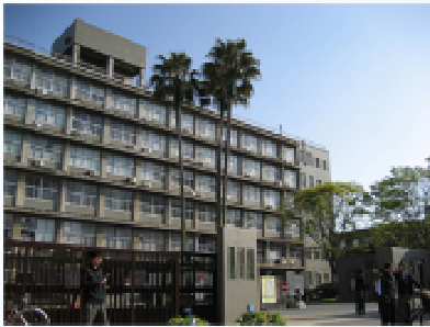
今はなき九大教養部キャンパス

これから、この土地の再開発が始まります。敷地の南側2/3は福岡地方裁判所関係の施設が移転してくるそうで、北側に複合施設が2ゾーン設けられるとか。住宅はともかく、商業施設はかなりきびしいと思うんですが。URが絡んでいます。博多リバレインのような、お役所企画にならなければいいんですが。