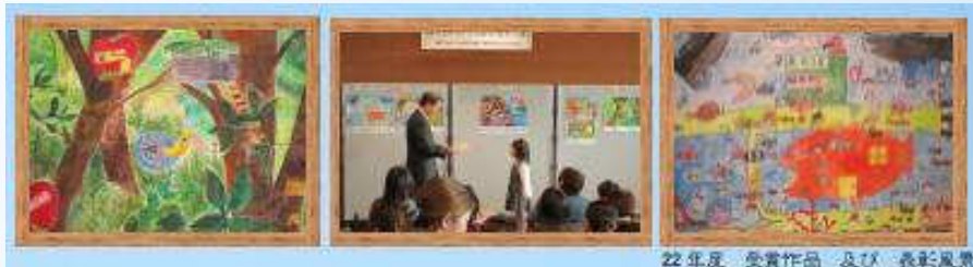
22年度 受賞作品 及び 表彰風景

今年も募集を開始しました。 今年は何んな作品が集まるでしょう。 北九州市内の小学生のみならず、 沢山応募して下さい。