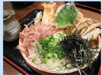
「和助」の冷やし野菜天ぶっかけ