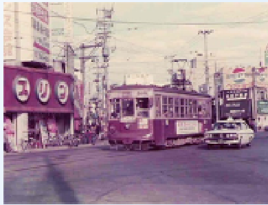
1975年の六本松交差点